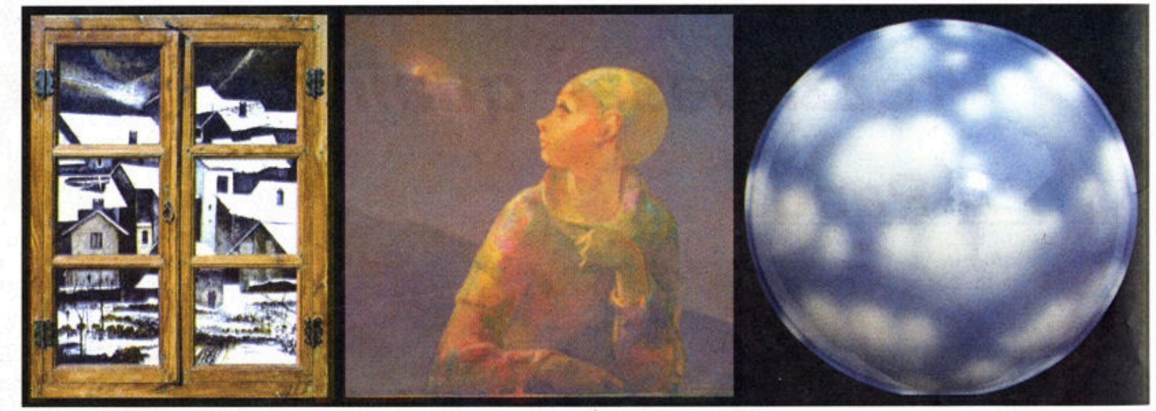
Sopra: a sinistra un ciondolo di Enzo Sciaivolino. Case e orti sotto la neve, di Tino Aime; Riverbero di Gabriel Girardi; Cielo catturato di Carena. A destra: particolare ceramica raku su plexyglass di Giuliana Cusino Angeli. Sotto: ancora Enzo Sciaivolino (Uccello su dito) e la Cavallina storna di Vinicio Perugia. Nella pagina a fronte: L'Isola, dipinto di Enzo Sciaivolino